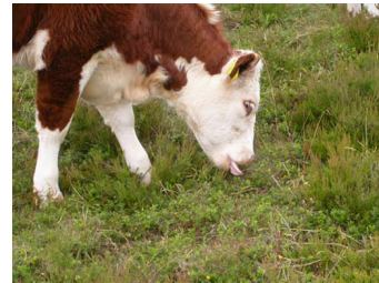
Den erfarne ko ved, hvad der smager godt. Det kan de små lære af.